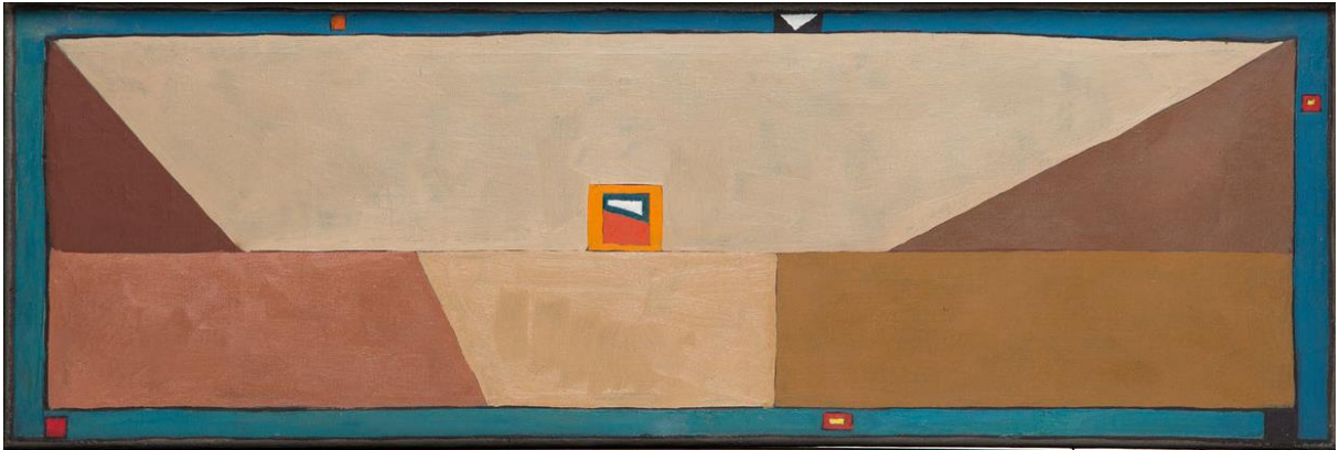
Jerzy Nowosielski, Kompozycja abstrakcyjna, 1965 r., olej/ płótno, 27 x 80 cm, fot. Marcin Koniak