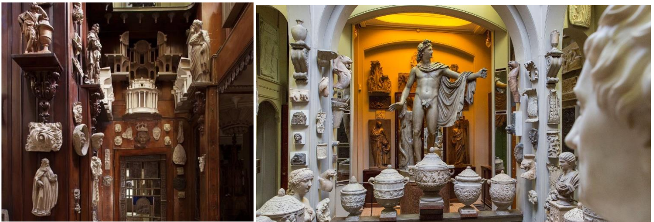
widok w Sir. John Soane Museum w Londynie